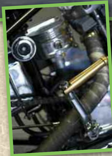
Dans la foulée Da Black Sheep projetée de visiter les p'tits gars du 38

vers le côté old school du milieu, que Ludo décide de revoir sa copie dans un style plus Frisco, Wild et DicE aidant bien sûr. Le plus gros des transfos de cet hiver-là se situe dans le changement du réservoir, le remplacement du carburateur, la pose d'un Z-bar, la fabrication de durites en laiton et d'une paire de cale-pieds metallflake de chez Kutty Hippy Killer que vend le fameux Da Black Sheep de Kustom Syndicate. Prenant la route pour aller récupérer les pièces à Genève, les gars du crew s'attendent alors à rencontrer un personnage un peu "inaccessible" qui fait des peintures de fou pour des mecs fortunés. La surprise est de taille quand ils s'aperçoivent que le gars est vrai et simple.